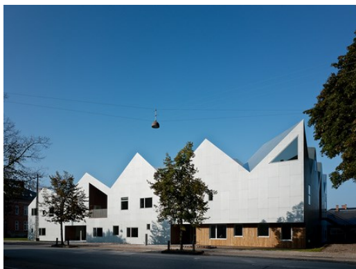
Center for Kræft og Sundhed København

I de dejlige omgivelser i centeret er der mulighed for at drikke en kop kaffe og tale med andre om de ting, der er aktuelle for dig.